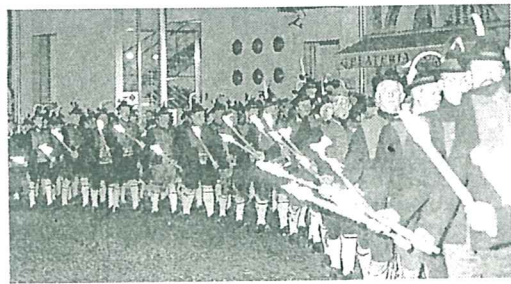
Una manifestazione degli Schützen a Bolzano

BOLZANO. Per l'8 novembre prossimo gli Schützen hanno annunciato a Bolzano una marcia "Contro il fascismo e per il Tirolo". Il tutto nel 90° anniversario della "Divisione del Tirolo".