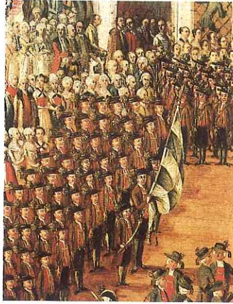
Die angetretenen Bozner "Bauernschützen" anlässlich der Vorführung des Bindertanzes am 6. Mai 1790

Als im Jahre 1986 die Bozner Schützenkompanie einen Großteil ihrer schadhaft gewordenen Trachten durch Neuanschaffungen ersetzen wollte, wurde durch die Arbeitsgemeinschaft