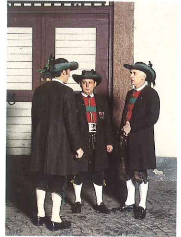
Mitglieder der Bozner Schützenkompanie in ihrer neuen Tracht.